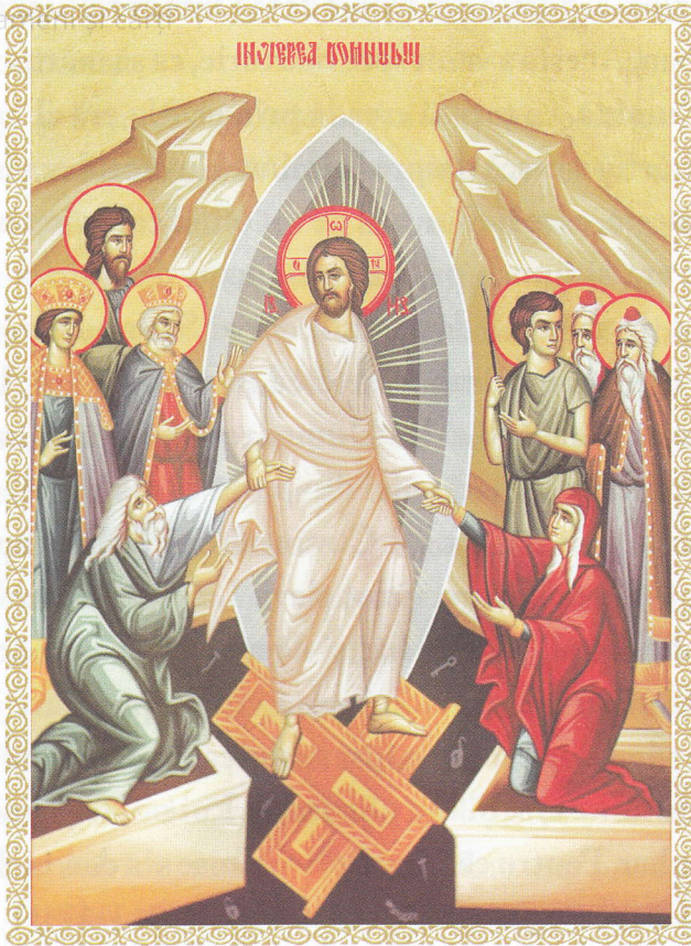
Învierea Domnului (Sfintele Paști)